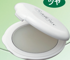
バーデンス リッププロテクターグロス